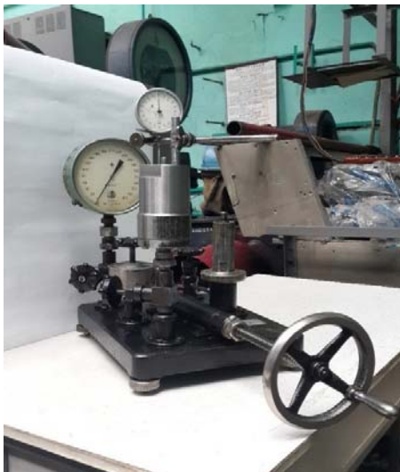
Рис. 2 – Лабораторна установка

установки, а також дослідні зразки клапанів представлені на рис. 2 та на рис. 3.