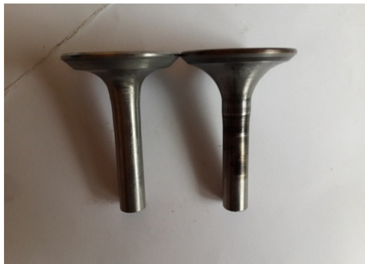
Рис. 3 – Дослідні зразки випускних клапанів

Для проведення експерименту були підготовлені два варіанти випускних клапанів дизеля СМД – 18Н (4ЧН12/14). Матеріал клапанів – сталь 4Х10С2М. Дообробка клапанів зводилась до укорочення стрижня, який в