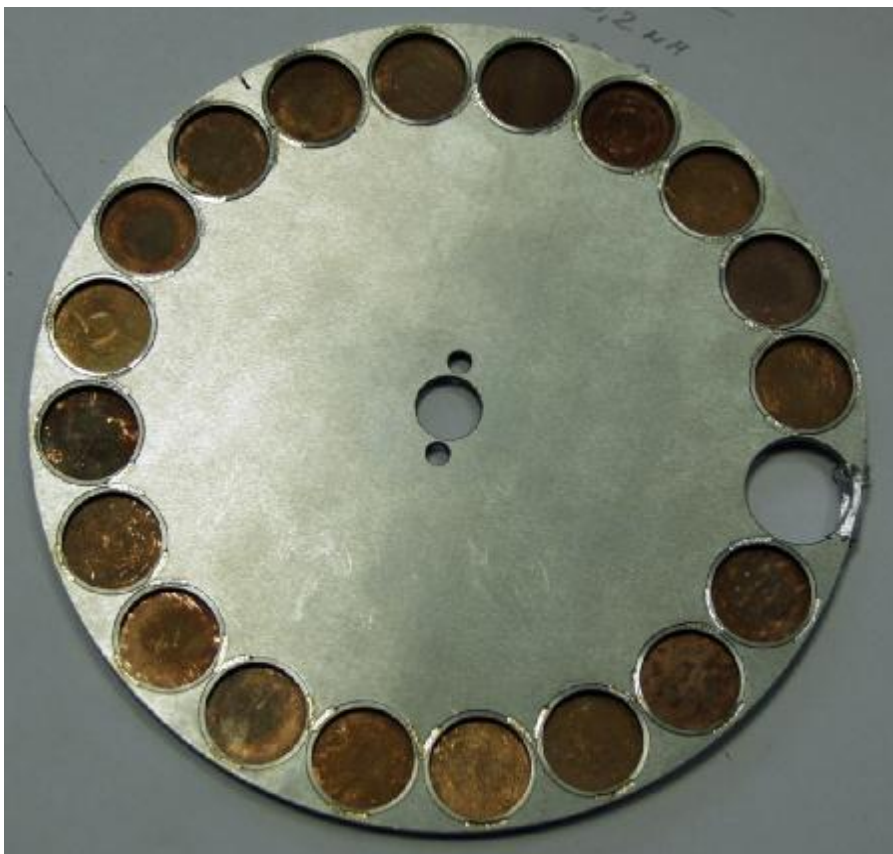
Рис.3 Диск (титан) с медными калибровочными образцами.

Анодное напряжение переключается шагами в динамическом режиме после набора заданного числа измерений. Подобный подход позволил получить высокую повторяемость результатов измерений и упростить процедуру калибровки толщиномеров, сведя ее к корректировке передаточной функции рентгеновского толщиномера. Внешний вид одного из дисков с калибровочными образцами представлен на рис.3.).