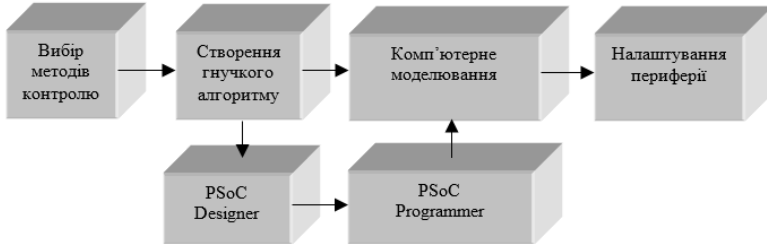
Рис. 2. Алгоритм проектування

часу електронних схем [4, 5]; ARES – засіб розроблення друкованих плат [3].