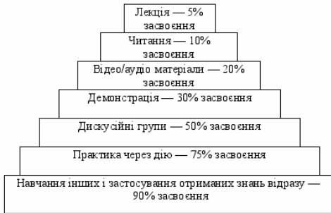
Рис. 2 Піраміда навчання

З піраміди видно, що найменших результатів можна досягти за умов пасивного навчання (лекції — 5%, читання — 10%), а найбільших — інтерактивного (дискусійні групи — 50%, практика через дію — 75%, навчання інших чи негайне застосування — 90%). Це, звичайно, середньостатистичні дані, і в конкретних випадках результати можуть бути дещо іншими, але в середньому таку закономірність може простежити кожен педагог.