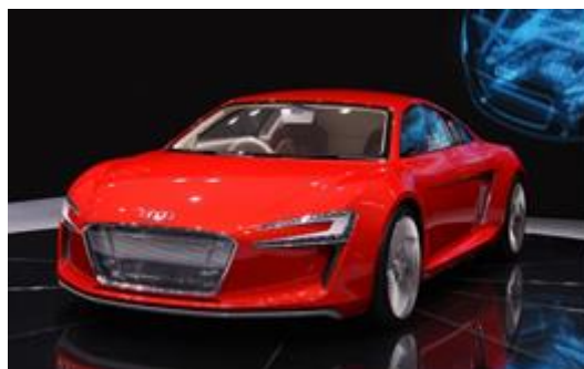
Рис.1 Гибридная модель Audi A3 e-tron

Дебютирует новая подвеска с такими амортизаторами на автомобилях модели «Audi», оснащаемых гибридной силовой установкой. Энергоактивные амортизаторы были представлены на официальной презентации новейшего гибрида модели Audi A3 e-tron. Концерн «Audi» пока не стал раскрывать все подробности новой разработки. Автором запатентована конструкция энергоактивного автомобильного амортизатора [1], которая имеет ряд преимуществ по сравнению с конструкцией амортизатора, предлагаемой для Audi A3 e-tron (рис.1).