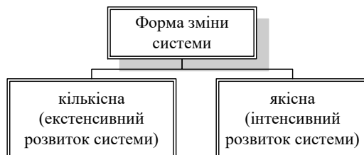
Рисунок 1 – Форми зміни розвитку системи

На основі системного підходу, який розглядає підприємство як складну систему, форми її розвитку наведено на рисунку 1. Слід відзначити, що найефективнішим напрямком розвитку підприємства як системи є її інтенсивний розвиток, який характеризується якісними змінами, в першу чергу, виробничих факторів, що може забезпечити необхідну економічну ефективність його діяльності.