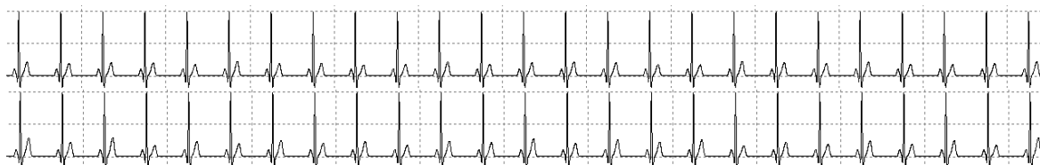
Рисунок 1 – ЭКГ со случайным искажением (вверху) и альтернатией (внизу) зубца T

В докладе рассматривается новый подход к обнаружению эффекта электрической альтернации сердца. Сложность решения задачи обусловлена тем, что реальные сигналы с наличием и отсутствием электрической альтернации внешне практически неразличимы (рис. 1) [1].