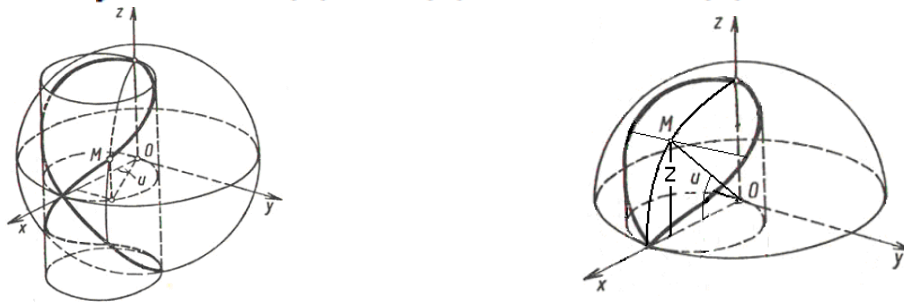
Рис.1. Схеми горизонтального і вертикального алгоритмів Вівіані

Класичну криву Вівіані описують у неявному виді системою рівнянь (x - r)^2 + y^2 = r^2 та x^2 + y^2 + z^2 = R^2 , або у параметричному виді x = R \cdot \cos^2(u) , y = R \cdot \cos(u) \cdot \sin(u) , z = \pm R \cdot \sin(u) .