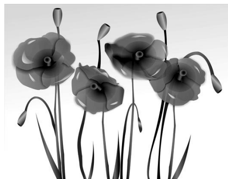
Рисунок 2 - Курс «Дизайнерські системи комп'ютерної графіки», тема «Види симетрії», завдання «Осьова симетрія»