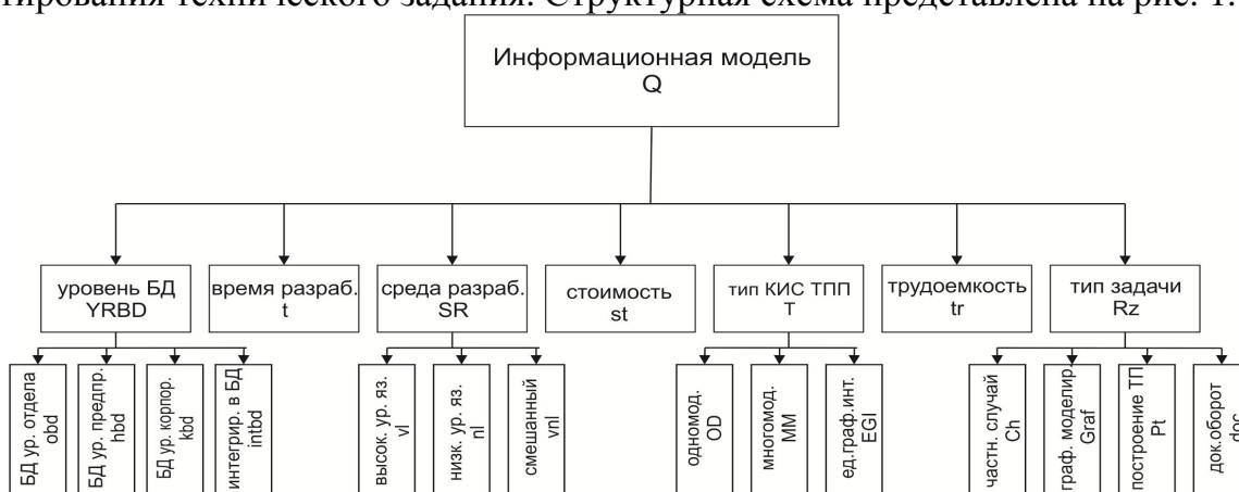
Рис. 1 – Структурная схема информационной модели КИС ТПП

Таким образом, исходя из заданных параметров, возможно, представить структурную схему информационной модели разработки КИС ТПП на ранней стадии проектирования технического задания. Структурная схема представлена на рис. 1.